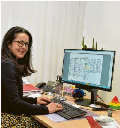
Im Zuge des Umbaus wurden auch die Räume der Mitarbeiterinnen und Mitarbeiter neugestaltet, die vom Marktbereich im Zentrum des Erdgeschosses abzweigen.