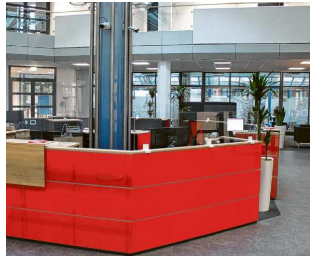
Im Zentrum des umgestalteten Marktbereichs der Sparkasse steht der ganz in Sparkassenrot gehaltene Servicepoint als zentrale Anlaufstelle für die Kunden.