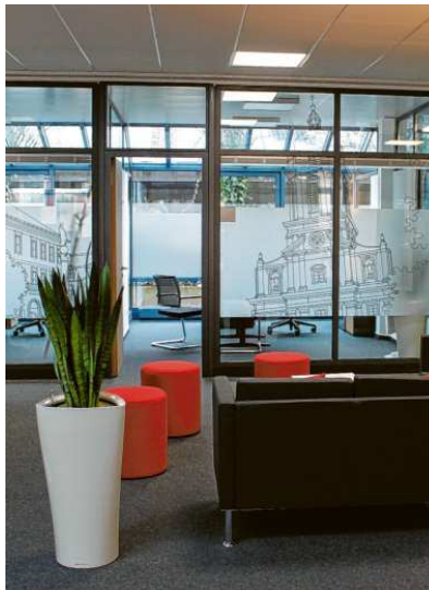
Loungecharakter hat die Sitzecke im großzügig und offen gestalteten Marktbereich der Sparkasse.