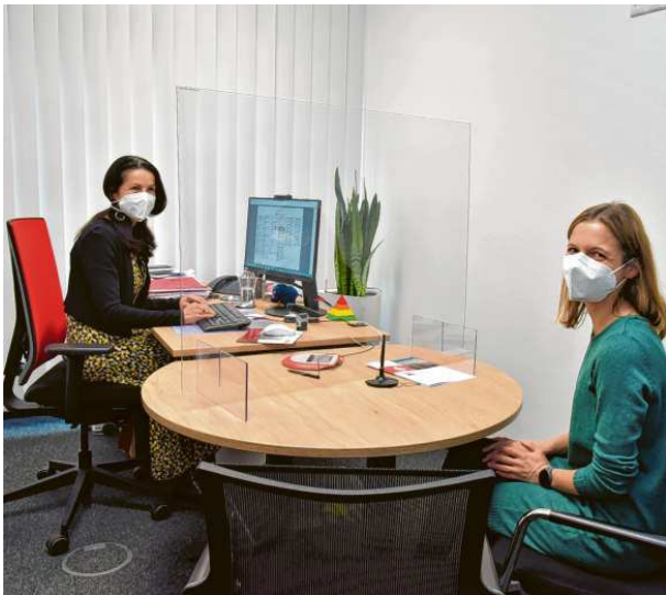
Blick in eines der zwölf neu entstandenen Beratungszimmer. Hier finden diskrete und individuelle Beratungsgespräche statt.