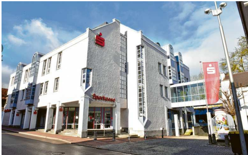
Von außen präsentiert sich die Hauptstelle der Sparkasse Neuburg-Rain unverändert, drinnen aber wurde der Marktbereich komplett umgebaut und modernisiert.

Kundenparkplatz hinter dem Haus bietet ausreichend Platz. Nicht nur für Kundenfahrzeuge, sondern auch für eine 122 Quadratmeter große Photovoltaikanlage, die dort auf einer Dachfläche errichtet wurde, um den Nachhaltigkeitsanspruch der Sparkasse zu unterstreichen. Der erzeugte Strom der 24,75 Kilowattpeak-Anlage wird in der Hauptstelle direkt selbst verwendet und wird den Bedarf an zugekauftem Strom deutlich senken. Ein weiterer Beitrag zur Nachhaltigkeit ist der Ersatz der bisherigen Leuchtkörper durch energiesparende LEDs. Text: hama